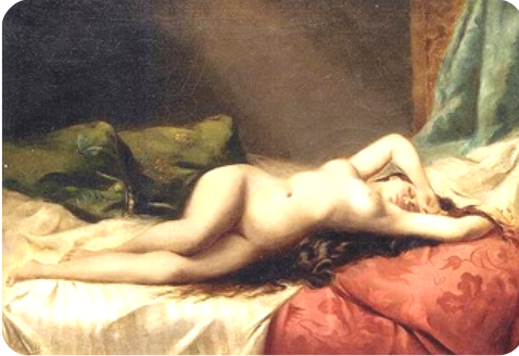
Nu à la libellule