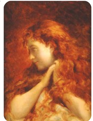
Jeune femme rousse

Par la suite il fit de ce genre sa spécialité et connut, malgré une carrière finalement courte, une véritable célébrité tout particulièrement aux Etats-Unis où ses tableaux sont présents dans de très nombreux musées.