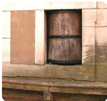
Tour de l'hospice de Mâcon