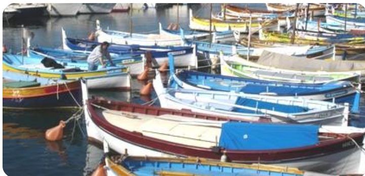
Collection de "pointus" - Nice