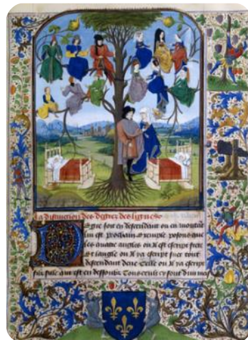
Arbre de consanguinité - France

Cette habitude n'empêchait pas chacun de distinguer parfaitement ses "vrais" oncles et tantes.