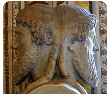
Le dieu Janus

Ces gestes devinrent coutumes et s'imposèrent tant dans l'état que dans la religion : des lois firent de ce jour un jour de fête dédiée tout particulièrement à Janus , le fameux dieu à double visage (l'un regardant l'année passée l'autre la prochaine).