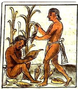
Récolte du maïs chez les Aztèques

Les Aztèques attribuaient à cette plante des vertus particulières dans le domaine de la force, de la vie et de la fertilité.